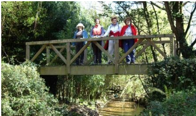
Sobre el río Frejulfe

En Villuir se alcanza la carretera N 634, que hay que cruzar para, sin perderla nunca de