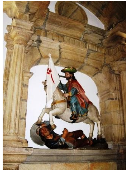
Santiago en la iglesia de Villapedre

Tras cruzar de nuevo la carretera y las vías del ferrocarril por un paso subterráneo, se llega en descenso a Villapedre , una parroquia más dedicada a Santiago, en cuyo templo se venera una imagen del Apóstol que perteneció al hospital de peregrinos de Luarca.