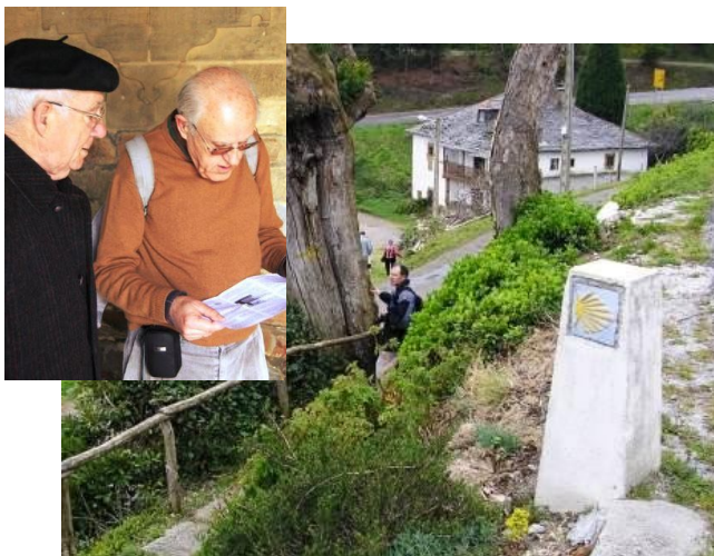
Año 2009. Bajando hacia Canero y conversando con el párroco jubilado del lugar.

costeros y es una de las más destacadas manifestaciones de asturianía, donde se mezclan la devoción a la Virgen, con la música el folclore y la cultura tradicionales. La danza prima y la jota de Cadavedo, son bailes obligados.