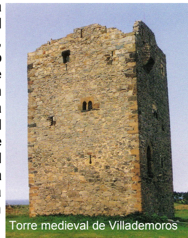
Torre medieval de Villademoros

La carretera, que se alterna con tramos de senda de tierra, es la forma de alcanzar el pueblo de Barcia , que Fernando II donó a la Orden de Santiago, a quien perteneció hasta la segunda mitad del siglo XVII y donde también hubo hospital de peregrinos. La parroquia está dedicada a San Sebastián.