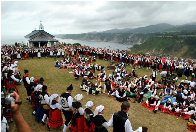
Danza Prima, en la romería de la Regalina, ante la ermita de la Virgen

costeros y es una de las más destacadas manifestaciones de asturianía, donde se mezclan la devoción a la Virgen, con la música el folclore y la cultura tradicionales. La danza prima y la jota de Cadavedo, son bailes obligados.