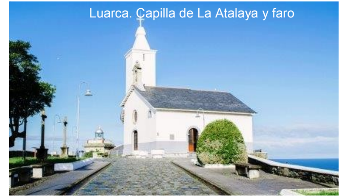
Luarca. Capilla de La Atalaya y faro

El caserío, muy diseminado, casi se confunde con el de Villar , aldea por la que pasa el camino, antes de comenzar el fuerte descenso que llevará hasta el centro de Luarca , una de las principales villas marineras de Asturias, aunque también antes de iniciar el descenso, haciendo un pequeño desvío, puede el peregrino acercarse a disfrutar del estupendo paisaje que se domina desde el faro y visitar la capilla de la Virgen Blanca o de la Atalaya y el bonito cementerio en el que reposa el Nóbél D. Severo Ochoa.