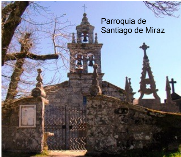
Parroquia de Santiago de Miraz