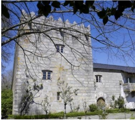
Miraz. Torreón de Saavedra

Laxes , donde se encuentra un b a r - restaurante y el albergue privado de O Abrigo.