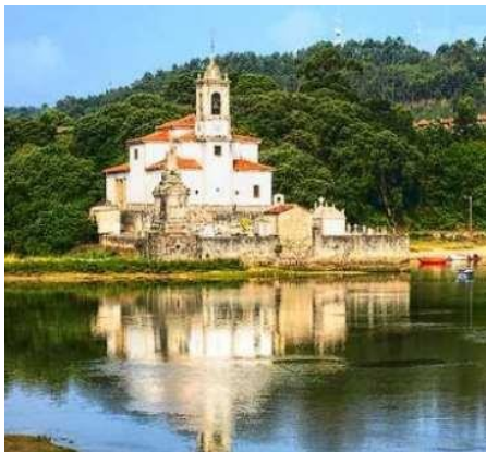
Barro. Ntra. Sra. de los Dolores

De su primera fábrica románica conserva la torre y una portada interior, ambas integradas en el edificio monástico levantado en el siglo XVIII..