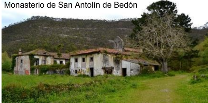
Monasterio de San Antolín de Bedón

Barro , localidad costera de servicios turísticos.