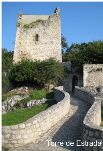
Torre de Estrada

Desde La Acebosa y su iglesia de San José, un camino bastante empinado lleva hasta el cementerio y después a los lugares de Hortigal , a orillas