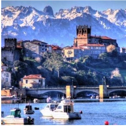
Vista de S. Vicente de La Barquera

lenguas de agua fue desde antiguo cuna de expertos marinos que se embarcaban en arriesgadas campañas en busca de la ballenas del Océano Atlántico o el bacalao de Terranova.