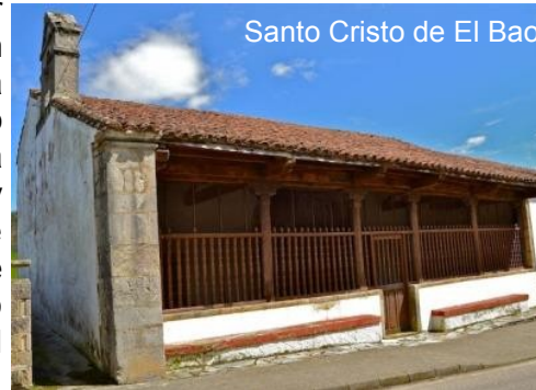
Santo Cristo de El Bao

Después de Pesués el camino continuaba, hace algunos años ascendiendo a media ladera del monte, por caminos en mal estado, a partir del año 2014, se ha modificado y actualmente discurre cercano al río y a la vía del ferrocarril, hasta la entrada en Unquera , localidad del municipio santanderino de Val de San Vicente.