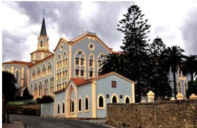
Cóbreces. Abadía de Santa María Viaceli

Los Villega, que no quisieron desmerecer de sus vecinos, financiaron la iglesia y otros dos colegios.