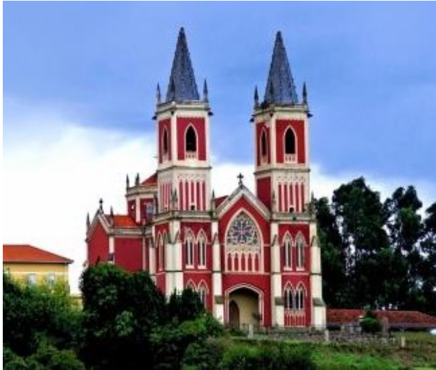
Cóbreces. Iglesia parroquial de San Pedro Advincula

Martín de Tours , templo de corte colonial, levantado en el siglo XVIII por un natural del pueblo que emigró a Perú y llegó a ser un alto funcionario del Virreinato. La gran casona que se levanta frente a la iglesia, perteneció a la misma familia.