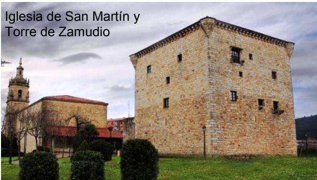
Iglesia de San Martín y Torre de Zamudio

fortificada con almenas y bocas de artillería.