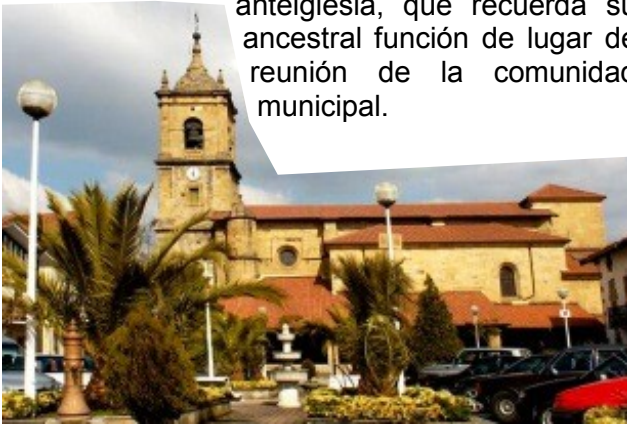
Santa María de Lezama

Dentro del pórtico conserva la mesa de la anteiglesia, que recuerda su ancestral función de lugar de reunión de la comunidad municipal.