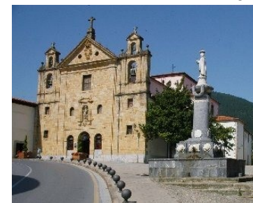
Markina . Convento Carmelitas

Como el camino sigue aproximadamente la carretera BI 2224 y se acerca a pequeñas aldeas, el autobús tratará de hacer tres puntos de contacto que van señalados en el croquis