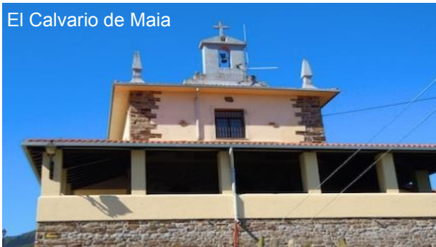
El Calvario de Maia

Una boscosa senda lleva hasta el alto, donde hay una nave ganadera y desde donde se puede ver por última vez el mar, antes de empezar a descender hacia el barrio de Olatz , que se alcanza tras cruzar otra carretera, la GI 3562, por la que el bus tratará de llegar hasta el