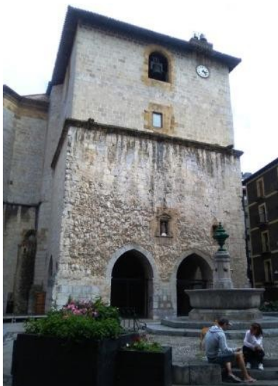
Deba. Santa María la Real

Para salir de Deba hay que cruzar la ría por el puente de la carretera GI 638 que va hacia Motrico y seguirla durante unos metros , antes de tomar un desvío que sale a mano izquierda.