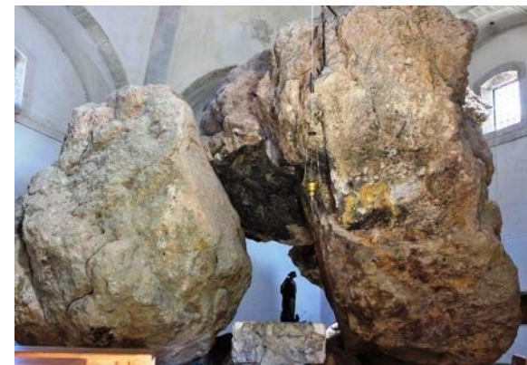
Altar de la ermita de San Miguel de Arretxinaga

Este último tramo de brusca bajada ha de