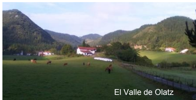
El Valle de Olatz

Junto a la fuente que hay en el lugar, hay que girar a la derecha para tomar un sendero de constantes subidas y bajadas para alcanzar una