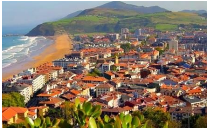
Vista panorámica de Zarauz

Alcanzamos primero la iglesia de San Nicolás de Bari , del siglo XIII, que formaba parte del viejo recinto defensivo y a continuación la Plaza de Orio.