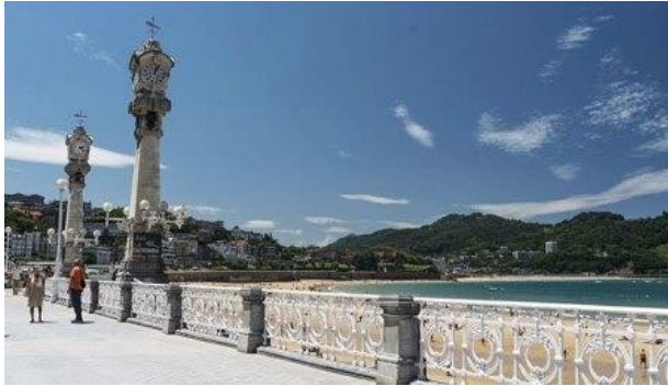
San Sebastián. Paseo de La Concha.

Esta disposición puede hacer que la parada del bus sea un poco difícil de localizar.