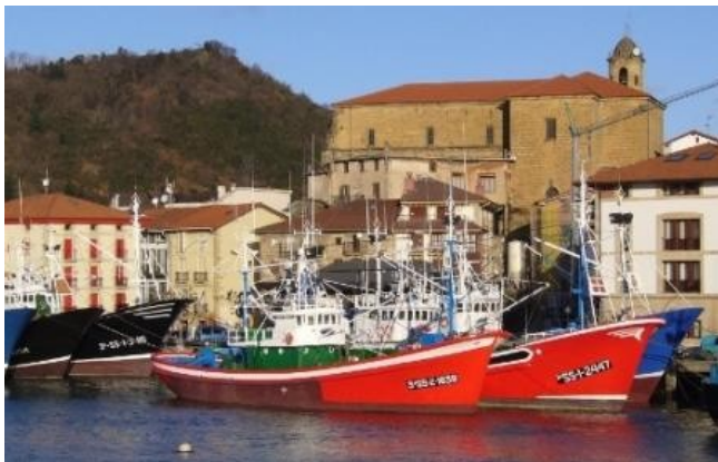
Ría de Orio

Después de pasar el caserío Munioeta , la carretera describe una gran curva a la izquierda, en este momento hay que dejarla por la derecha para seguir una calzada empedrada que desciende rápidamente hasta alcanzar de nuevo la carretera, pasar bajo la autopista y comenzar a subir un fuerte repecho hacia la