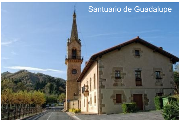
Santuario de Guadalupe

El que debemos seguir va por la calle de Los Fueros, Paseo de Colón y la calle