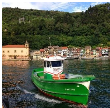
"La motora" de Pasajes

A partir de aquí un sendero reorre a media ladera el Monte Mendiola, con constantes subidas y bajadas.