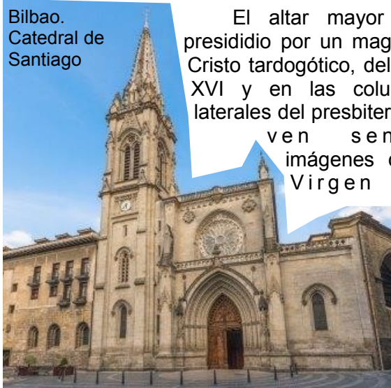
Bilbao. Catedral de Santiago

El altar mayor está presidido por un magnífico Cristo tardogótico, del siglo XVI y en las columnas laterales del presbiterio, se ven sendas imágenes de la Virgen de