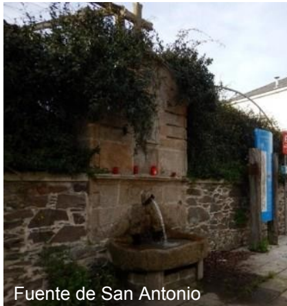
Fuente de San Antonio

Por Sigrás de Abaixo y Sobrecarreira se alcanza la parroquial de Santiago de Sigrás que conserva elementos románicos, un crucero y la casa rectoral que fue hospital de peregrinos.