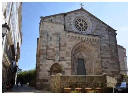
A Coruña. Iglesia de Santiago

La etapa debería de comenzar en el puerto de A Coruña, al que los buques procedentes de los países del norte arribaban guiados por el faro romano de la Torre de Hércules , levantado en el siglo II y restaurado en 1788.