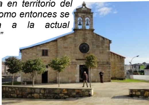
O Burgo de Santiago

fundada en territorio del Faro, como entonces se llamaba a la actual Coruña”