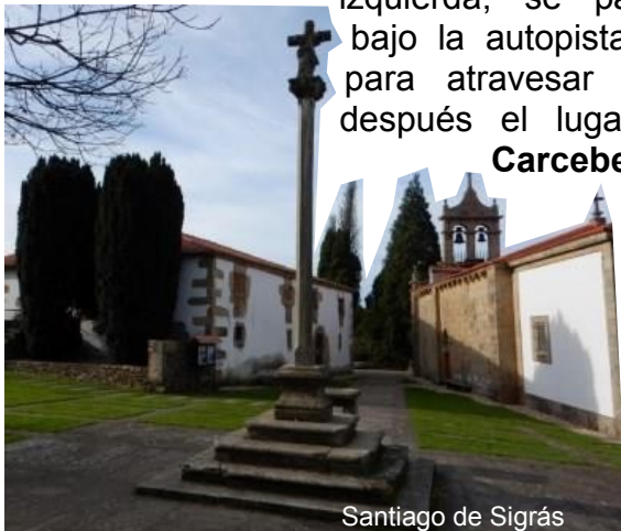
Santiago de Sigrás

bajo la autopista A9, para atravesar poco después el lugar de Carcebelo