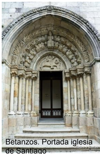
Betanzos. Portada iglesia de Santiago

Aunque el final de etapa es Bruma , será necesario prolongar un poco la caminata, hasta Mesón do Vento , donde el autobús tendrá aparcamiento porque está al borde de la carretera N 505 y donde hay bares y restaurantes.