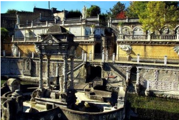
Betanzos. Parque del Pasatiempo

El municipio no tiene apenas ninguna concentración urbana, la capital es San