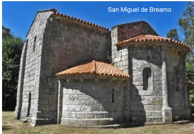
San Miguel de Breamo

Al dejar Pontedeume , puede el caminante hacer un pequeño desvío para visitar el templo del monasterio de San Miguel de Breamo , una de las iglesias románicas más hermosas de la comarca. Pertenece a finales