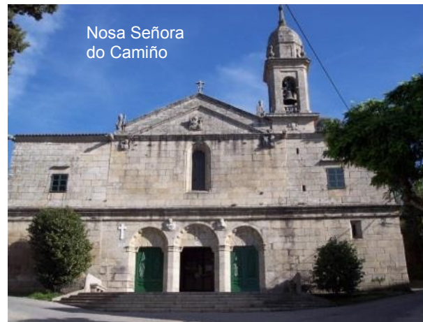
Nosa Señora do Camiño

Por el lugar de O Barral se baja la Cuesta de Sabugueiro hasta los Molinos de Caraña , para cruzar el cauce del mismo nombre y continuar por el Camino de Refoxo hasta la iglesia de Nosa Señora do Camiño , que se venera en un templo renacentista