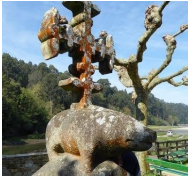
Crucero en Ponte do Porco

Aparece muy pronto el lugar de Ponte do Porco , en la desembocadura del río