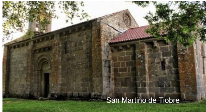
San Martiño de Tiobre

El lugar ya se cita en el siglo IX. Está