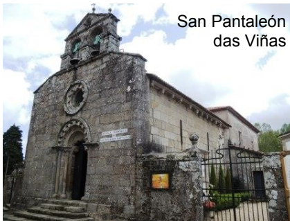
San Pantaleón das Viñas

Continúa la ruta ascendiendo hacia Montecelo , lugar en el que el camino discurre entre la iglesia de San Pantaleón das Viñas , que conserva su portada románica, y el Pazo .