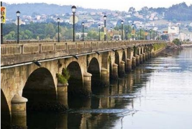
Pontedeume. Puente sobre el río Eume

Poco antes de avistar la Playa de la Magalena , se deja a la izquierda la capilla