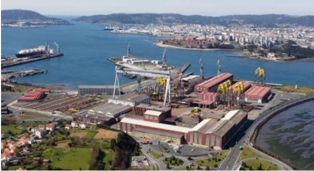
Panorámica de Fene y astillero de Navantia

Van apareciendo a continuación otros pequeños pueblos como Chamoso y