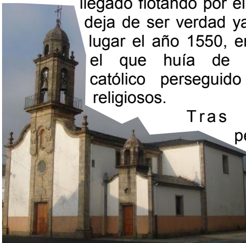
Santa María de Neda

Una vez rebasado el albergue de peregrinos, siguiendo el paseo marítimo, se alcanza la iglesia de Santa María construida en el siglo XVIII, sobre las ruinas del templo de Santa María do Porto. En ella se venera el Cristo da Cadea , que preside el retablo mayor. La imagen cuenta con la correspondiente tradición popular de haber llegado flotando por el río, lo que no deja de ser verdad ya que arribó al lugar el año 1550, en un barco en el que huía de Inglaterra un católico perseguido por motivos religiosos.