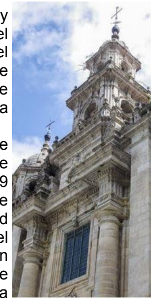
Pontedeume Iglesia de Santiago

En la Calle Real de Pontedeume , de casas con soportales, se conserva el palacio del que fue arzobispo de Compostela , Bartolomé Raxoi, natural de la villa.