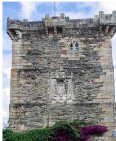
Pontedeume. Torreón de los Andrade

El puente tiene más de seiscientos metros de longitud y contaba con 79 arcos, de los que conserva en la actualidad 15. Fue construido en el siglo XIV por Fernán Pérez de Andrade. Entre los arcos 20 y 21, había una pequeña capilla y un hospital para peregrinos y enfermos que contaba con doce camas.