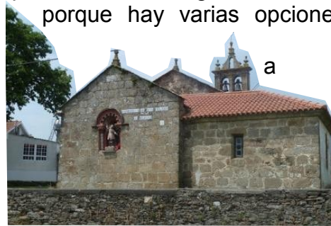
A Rua Iglesia de San Paio de Buscás

y Oroso Pequeño o girar hacia la derecha siguiendo una larga recta que discurre paralela a la autopista y nos lleva hacia un lateral del polígono industrial que precede la llegada a Sigüeiro , la capital del concejo de Oroso y final de esta etapa.