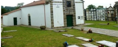
Cabeza de Lobo. Iglesia de San Pedro

Al abandonar el pueblo, se debe de cruzar, con las debidas precauciones la carretera DP3802 y llegar a Carballo y A Casanova .