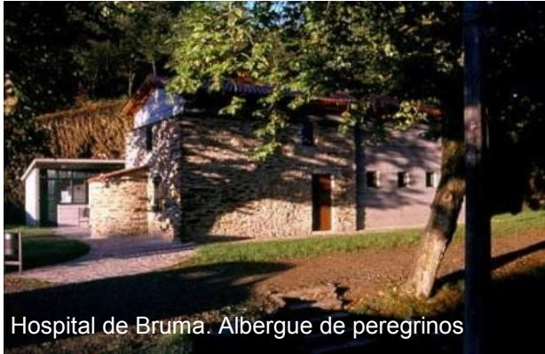
Hospital de Bruma. Albergue de peregrinos

este nombre de Buscás figura el lugar en algunos mapas.